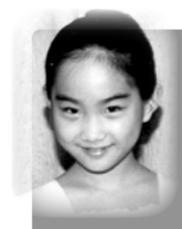
6 Aika Dan Japan, 1996

Chopin Etüde C-Dur op. 10 Nr. 1 Beethoven Sonate c-Moll op. 13 („Pathétique“) 1. Grave, Allegro di molto e con brio Chopin Scherzo h-Moll op. 20 Debussy Toccata (aus „Pour le piano“)