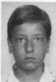
Dmitry Pavlov, 1976 UdSSR

Étude f-Moll „La leggerezza“ Sinfonia A-Dur Sonate c-Moll op. 13 („Pathétique“) 1. Satz: Grave, Allegro di molto c con brio Oktober (aus „Jahreszeiten“) Humoresque op. 10 Nr. 5