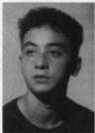
Wibi Soerjadi, 1970 Niederlande

Haydn Sonate D-Dur Hob. XVI/37 1. Satz: Allegro con brio Bach Präludium und Fuge Cis-Dur WK I Liszt Paganini-Etüde Nr. 3 gis-Moll „La campanella" Beethoven Sonate C-Dur op. 53 („Waldstein") Allegro con brio – Introduzione. Adagio molto – Rondo. Allegretto moderato Chopin Etüde c-Moll op. 10 Nr. 12 Liszt Ungarische Rhapsodie Nr. 6 Prokofjew, Sonate Nr. 7 op. 83 Allegro inquieto – Andante caloroso – Precipitato