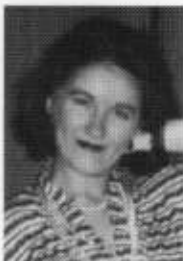
Alexandra Vinokur, 1970 Österreich