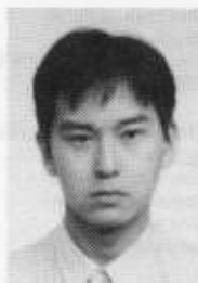
Susumu Aoyagi, 1969 Japan