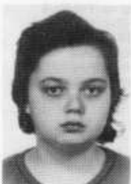
Aliya Nazarbayeva, 1980 UdSSR

Etüde C-Dur op. 299 Nr. 32 Sinfonia F-Dur Sonate C-Dur KV 330 1. Satz: Allegro Walzer cis-Moll op. 64 Nr. 2 Walzer h-Moll op. 69 Nr. 2