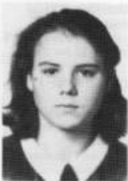
Afrodite-Maria Kalantzopoulou, 1973 Griechenland

Haydn Bach Rachmaninow Schubert Chopin Debussy Schnittke Sonate 1. Satz Präludium und Fuge Étude-Tableau a-Moll op. 39 Nr. 6 Sonate A-Dur op. 120 Allegro moderato – Andante – Allegro Ballade g-Moll op. 23 L'isle joyeuse Introduction und Fuge